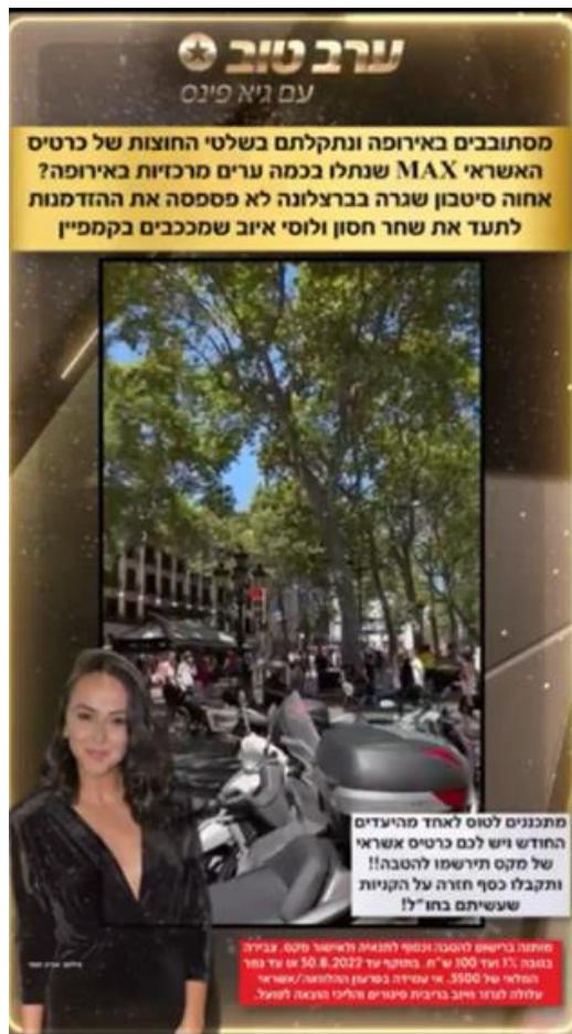
ערב טוב עם גיא פינס